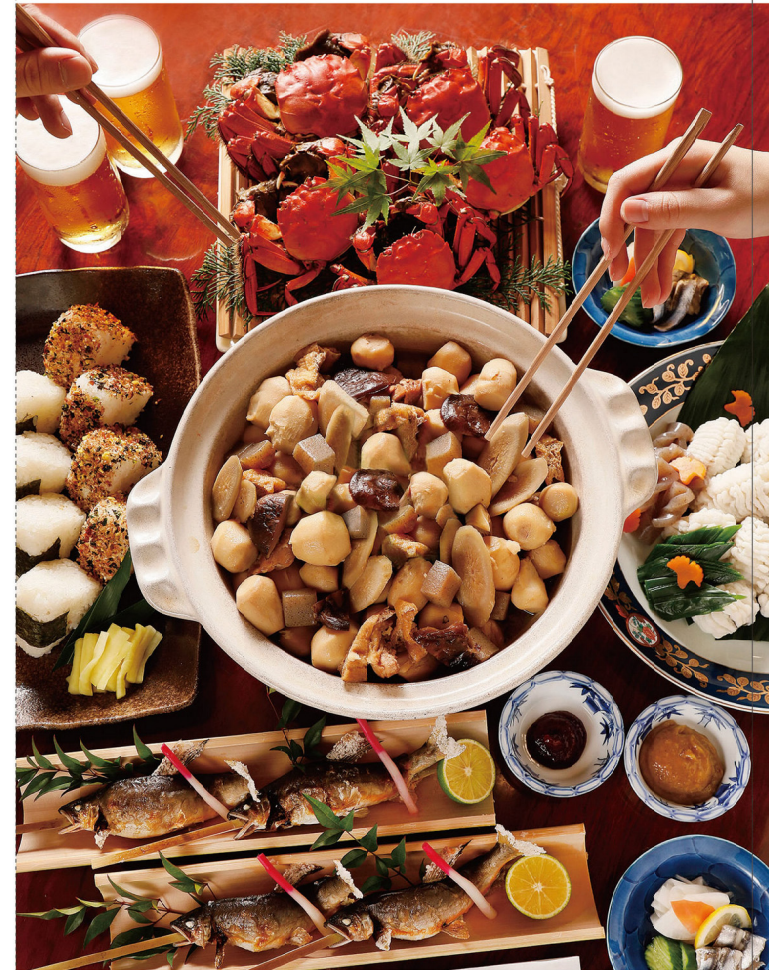
Taro Soup with Chicken and Vegetables.