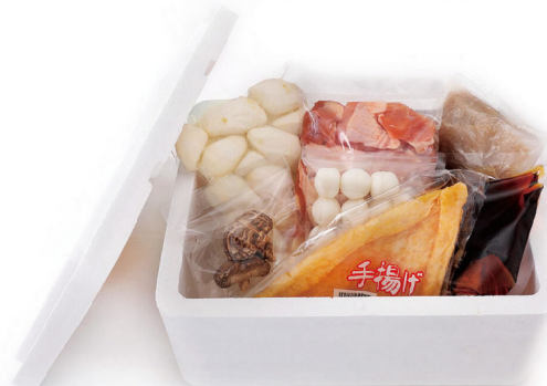
※いもたきセットのイメージ写真